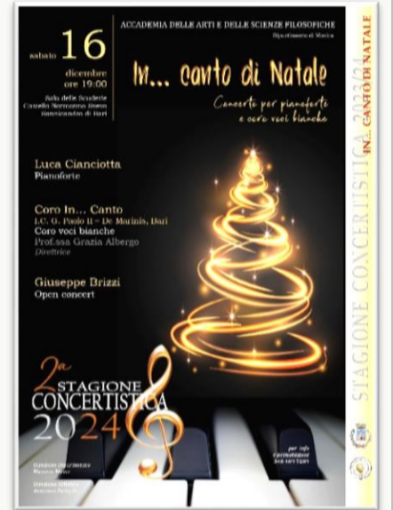
La suggestiva locandina dell'evento